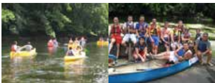
Dernière descente d'un "coach gabarier" avec son équipage

Comme je l'ai dit à la dernière assemblée générale, je souhaite à tous les membres de ce club, de poursuivre leurs chemins avec réussite et d'écrire de nouvelles pages dans le grand livre du F.C.A, sans oublier cette devise qui m'est chère : « Ne pas se prendre pour ce que l'on n'est pas, mais savoir ce que l'on veut être ».