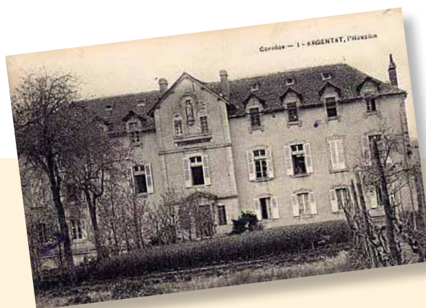
Ancien hospice transformé en hôpital pour les blessés de guerre