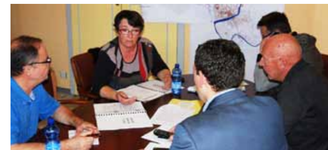
Le Poste de Commandement Communal lors de l'exercice du 12 novembre 2015

coup dur, les élus et les agents trouveront immédiatement toutes les réponses et les actions à mettre en place afin d'accompagner la population si la ville venait à être confrontée à un événement majeur (inondation, tempête, rupture de barrage, ...).