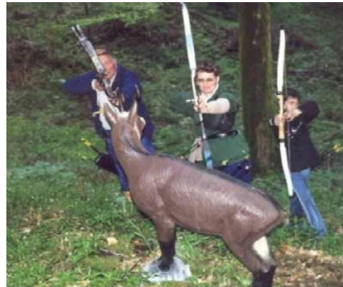
Tir à l'arc, tir 3D