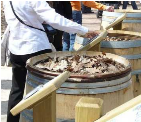
Parcours pédagogique /sensoriel