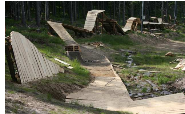
VTT, bike park