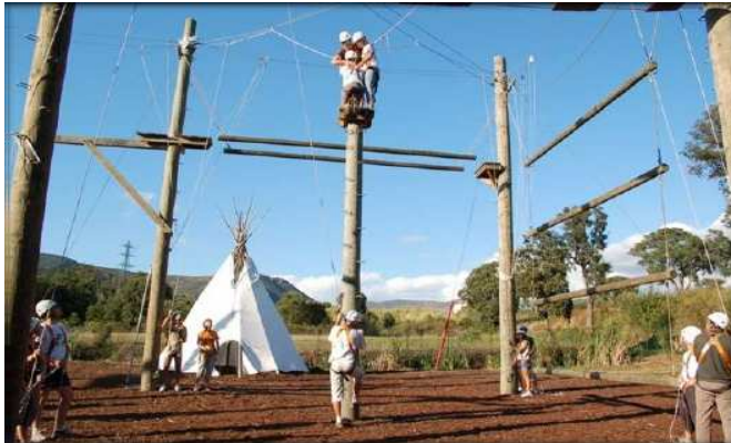
Plateau de cohésion de groupe